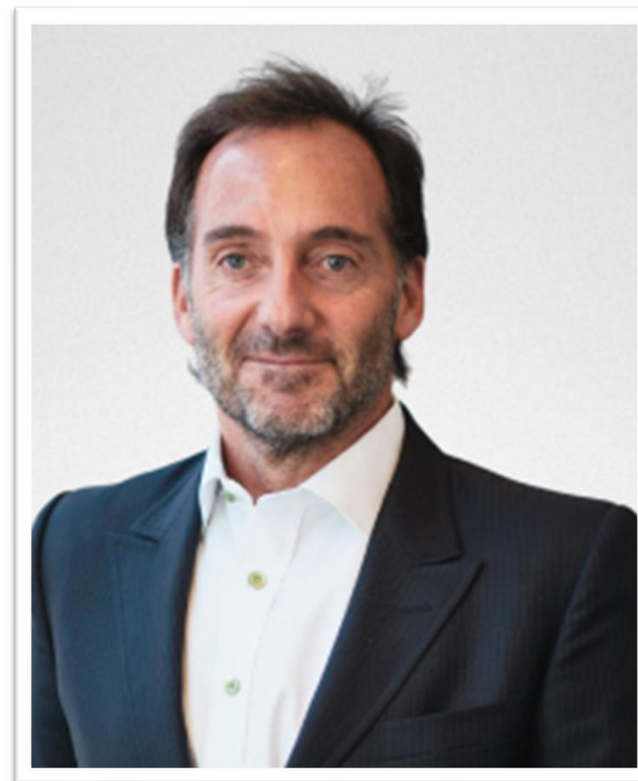
Director de Falabella S.A. desde 2002, actualmente Vicepresidente