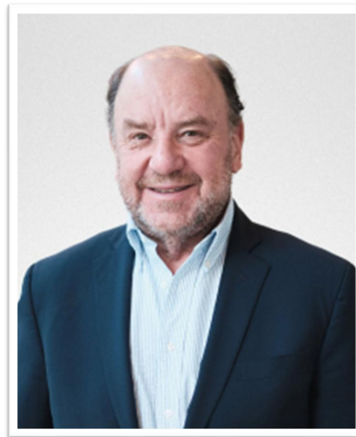
Director de Falabella S.A. desde 2023