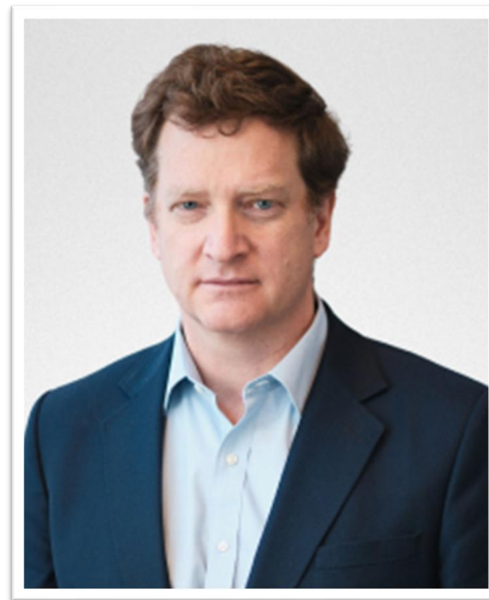
Director de Falabella S.A. desde 2011