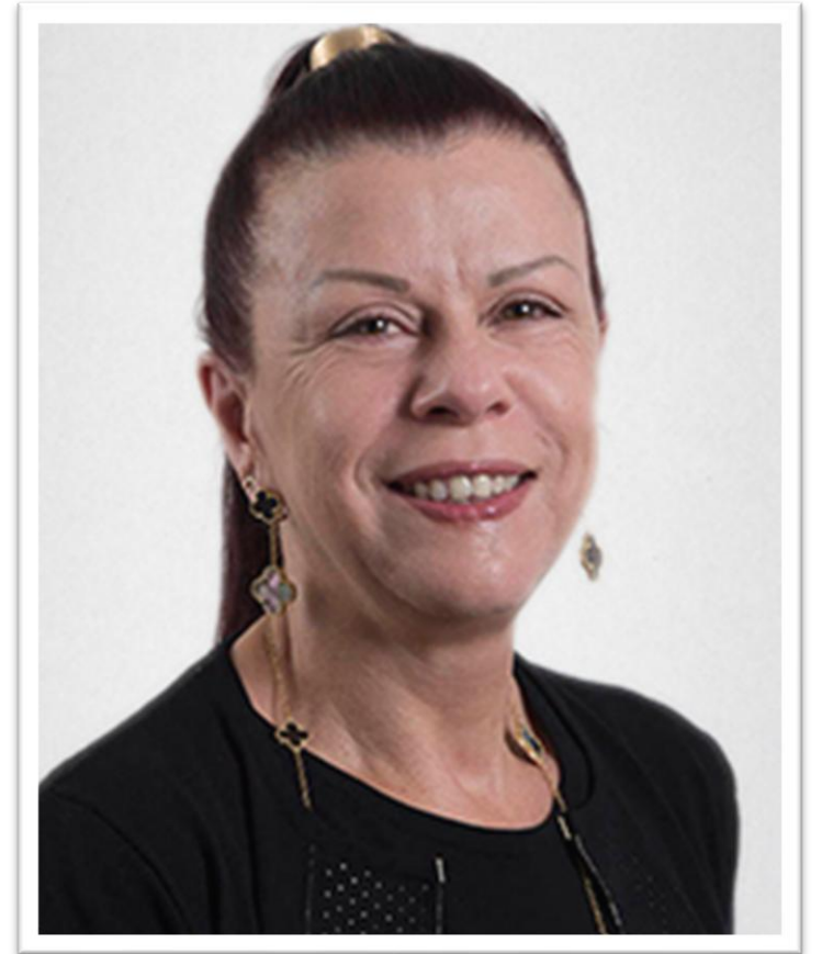
Directora de Falabella S.A. desde 2003